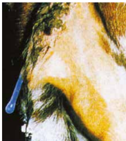
Priešrujo etapu gleivės būna pilkos ir standžios, o vėliau jų kiekis sumažėja ir jos tampa skaidrios. Gleivės nėra skaidulingos ar lipnios.