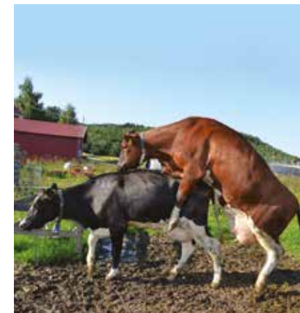
Pasirengimo kergti stovėsena. Karvės atsistoja kergimui tinkama poza. Stovėjimo refleksas yra patikimiausias rujos ženklas. Galvijai, kurie lipa ant kitų, taip pat gali ruoti ir jie paeiliui gali lipti vienas ant kito.

Rujos metu laisvai ganomos karvės arba ganyklose esančios karvės sudaro vadinamąsias seksualiai aktyvias grupes. Rujojančios karvės laikosi šalia kitų (trijų metrų atstumu) ir parodo akivaizdžius rujos požymius. Jei bandoje rujoja tik viena karvė, priešrujos etape esantys galvijai arba nerujojantys galvijai gali suformuoti SAG grupes kartu su rujojančia karve. Tokiose grupėse rujojančios karvės partneris gali vis keistis. Rujojantys galvijai prie seksualiai aktyvių grupių gali prisijungti iki 1/3 laiko, kol galvijai stovi pasirengimo kergimui pozicijoje. Tokias grupes reikia stebėti, nes bent viena rujojanti karvė bus tokios grupės dalimi.