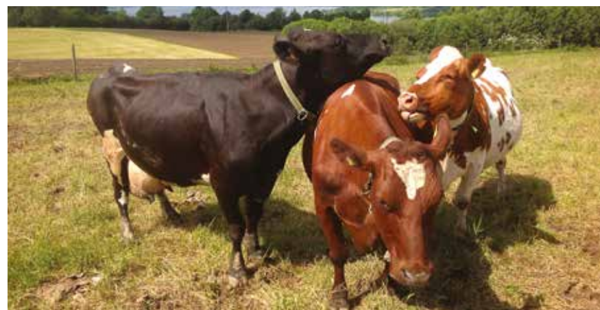
Seksualiai aktyvi grupė (SAG). Du ar daugiau vienu metu rujojančių galvijų grupė stovės netoli vienas kito. Jie rodyt ir priims rodokus ženklus, pavyzdžiui, lipimo, galvos priglaudimo, laižymo ir uostymo.