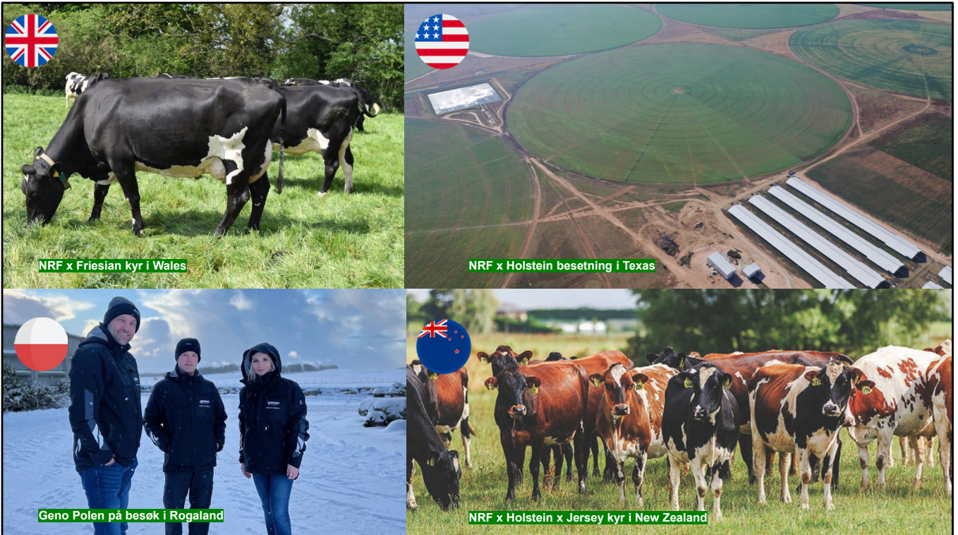
NRF x Friesian kyr i Wales